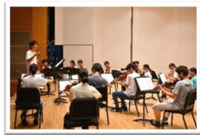
♪京都市交響楽団のメンバーによるパート練習の様子♪

本番:2026年8月10日(月)午後2時開演予定(約1時間の公演) 会場:京都市呉竹文化センター ホール 指揮:松川 創 曲目:モーツァルト:《フィガロの結婚》序曲 J.ウィリアムズ:レイダース・マーチ エルガー:《エニグマ変奏曲》より〈ニムロッド〉 ハイドン:交響曲第94番「驚愕」より 第2楽章 アンダーソン:ザ・ゴールデン・イヤーズ チャイコフスキー:幻想序曲《ロメオとジュリエット》