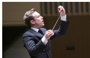
ダニエル・ハーディング