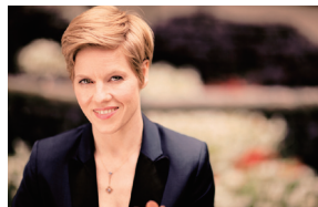
イザベル・ファウスト