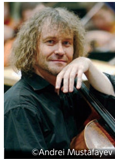
アレクサンドル・クニャーゼフ

6.12 水 19:00開演 | アンサンブルホールムラタ | 全席指定 | チケット発売 5/24(金)