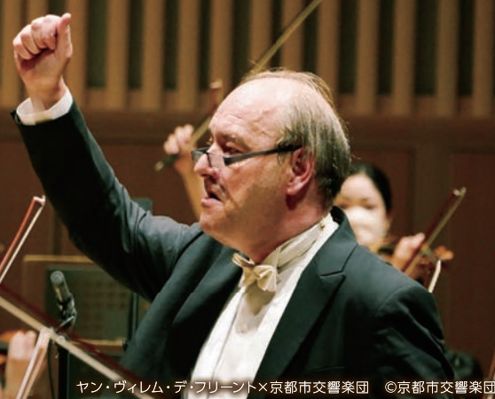
ヤン・ヴィレム・デ・フリーント×京都市交響楽団

The 689th Subscription Concert of the City of Kyoto Symphony Orchestra