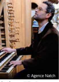
バンジャマン・アラール

国内最大級のパイプオルガンを気軽に楽しんでいた多く人気シリーズ「オムロン パイプオルガン コンサートシリーズ」。第78回はフランスの名手バンジャマン・アラールによる、オール・バッハ・プログラムをお届けします。オルガンのための多彩な作品を通して、バッハの繊細さと圧倒的な構築美の両面を若き巨匠アラールが鮮やかに体現します。