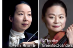
沖澤のどか 五嶋みどり

(70周年記念プレミアム定期)は、沖澤のどかの指揮のもと、前半には世界的ヴァイオリニスト五嶋みどりもソリストに迎えて、ショスタコーヴィチのヴァイオリン協奏曲第1番を披露。後半はマエストロ沖澤が継続して紹介する女性作曲家の作品から、アメリカの黒人女性作曲家F. ブライスの交響曲第1番を。パースタイン「キャンディード」序曲と共に「The American」のイズムをお楽しみください。