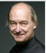
ヤン・ヴィレム・デ・フリースト