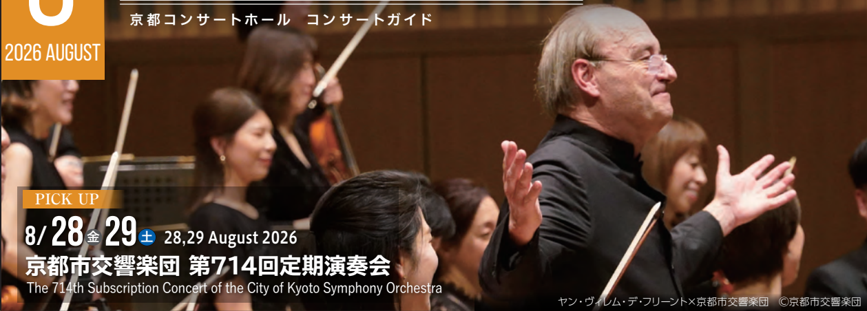
ヤン・ヴィレム・デ・フリースト×京都市交響楽団

The 714th Subscription Concert of the City of Kyoto Symphony Orchestra