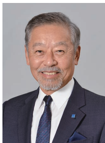
公益財団法人京都市 音楽芸術文化振興財団 理事長

結びに、本年もこの音楽祭が、多くの方々に「芸術の秋」の心地良いひとときをお届けできることを願っております。