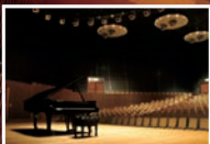
アンサンブルホールムラタ

プロ・アマチュア問わず音楽専用ホールならではの音響空間で演奏を楽しむことができます。貸館のご予約は18箇月前の初日から電話または窓口にて受付しています。