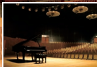
アンサンブルホールムラタ

フルオーケストラや室内楽、ピアノ 発表会から合唱、吹奏楽までプロ・ アマチュア問わず音楽専用ホール ならではの音響空間で演奏を楽し むことができます。貸館のご予約は 18箇月前の初日から電話または窓 口に受付しています。