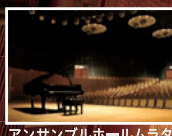
アンサンブルホールムラタ

貸館に関する詳細は、ホームページをご覧ください。 https://www.kyotoconcerthall.org/flow/