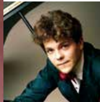
シモン・ネーリング

10月28日(土) 14:00 開演 | 全席指定 | チケット発売 会員先行 6/10(土) 一般発売 6/17(土)