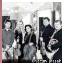
パボラーク・アンサンブル

12月1日(金) 19:00 開演 | 全席指定 | チケット発売 会員先行 7/1(土) 一般発売 7/8(土)