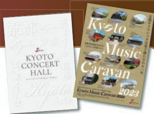
2023年度年間パンフレット 「Kyoto Music Caravan 2023」総合パンフレット

また文化庁京都移転と京都市立芸術大学新キャンパス移転を記念して「Kyoto Music Caravan 2023」を開催します。当イベントでは、京都市内11区の名所や観光地などで無料コンサートを、そして京都市立芸術大学新キャンパスでは、京都市でクラシック音楽を学ぶ子どもや学生たちによる「スペシャル・コンサート」を予定しており、京都のまちをクラシック音楽で満たします。どうぞお楽しみに!