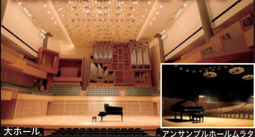
大ホール アンサンブルホールムラタ

京都コンサートホール貸館利用のご案内 フルオーケストラや室内楽、ピアノ発表会から 合唱、吹奏楽までプロ・アマチュア問わず、音 楽専用ホールならではの最適な条件で演奏を たのむことができます。貸館の受付は18箇月 前の初日から受付しています。はじめてのご利 用の方にも専門スタッフがサポートいたします ので、お気軽にお問合せください。