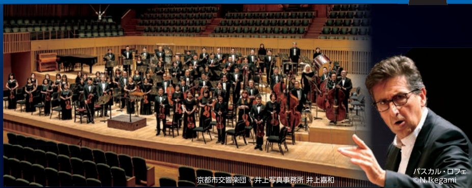
京都市交響楽団