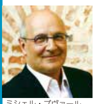
ミシェル・ブヴァール

国内最大級のバイブオルガンを気軽に楽しんでいた人気シリーズ「オムロン バイブオルガン コンサートシリーズ」。記念すべき70回目は、「世界のオルガニスト」と題し、フランスを代表する巨匠オルガニストのミシェル・ブヴァールを迎えます。待望の京都初公演となる今回、今年生誕200年を迎えるセザール・フランクの作品を中心にとしたプログラムをお届けします。どうぞご期待ください。