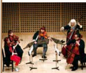
アンサンブル弦伍楼

ロックバンド、くるりのメンバー岸田繁が命名し、京響メンバーが中心となって結成された弦楽五重奏団「アンサンブル弦伍楼」。3回目も岸田繁の委嘱作品を披露するほか、「1970年代プロレ風」に書かれた吉松隆の楽曲など、弦伍楼カラー満載でお届けします。ほかでは聴くことのできないアンサンブルにご期待ください!