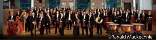
ロンドン交響楽団

2022/2023シーズンを最後に、ロンドン交響楽団音楽監督の座を退くサー・サイモン・ラトル。国内でラトル×LSOコンビを聴く最後のチャンスです。プログラムは、「これぞオーケストラ」とも言うべき名曲の数々。特にブルックナーは、マエストロがこだわって選曲した究極の一曲です。豪華絢爛なオーケストラの音世界に皆さまを誘います。