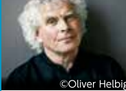
サー・サイモン・ラトル