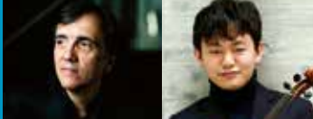
エリック・ル・サーージュ